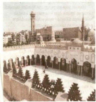
Universiti al-Azhar antara pusat ilmu yang bermula dari perpustakaan masjid.