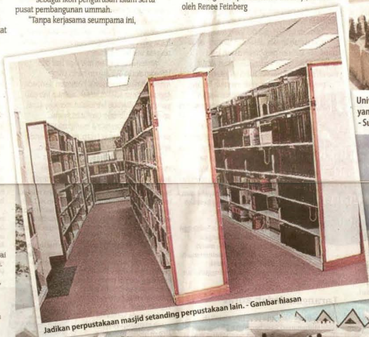
Jadikan perpustakaan masjid setanding perpustakaan lain. - Gambar hiasan

Tingkatkan fungsi masjid sebagai pusat ilmu