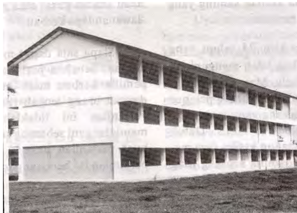
Bangunan baru Al-Madrasah Al Alawiyah Addiniyah Arau yang dibina oleh Yayasan Islam Negeri Perlis.