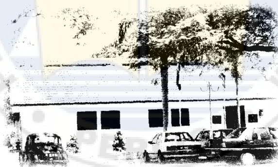
Bangunan lama MPK berhampiran Pejabat Setiausaha Kerajaan Kangar