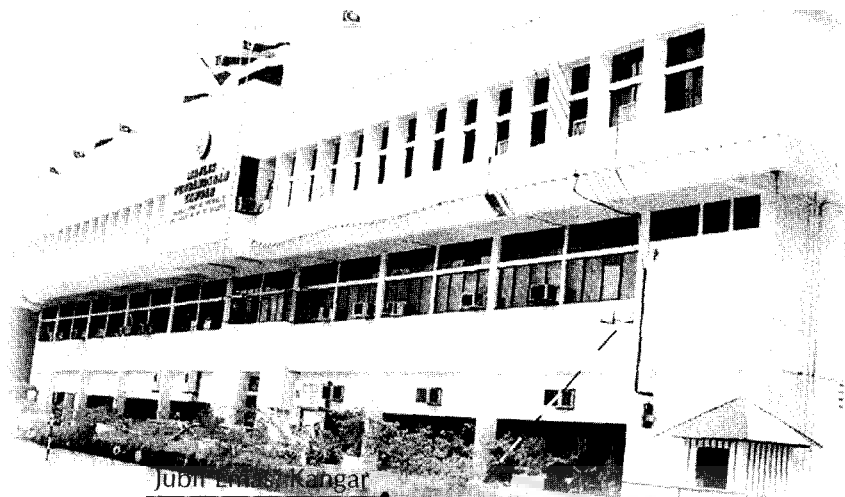
Bangunan MPK sekarang di Persiaran Jubli Emas, Kangar