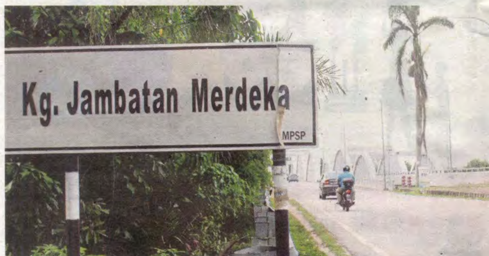
Kampung yang terletak berhampiran dengan Jambatan Merdeka dinamakan sempena jambatan berkenaan.

Oleh Nor Farhani Che Ad bminggu@bh.com.my