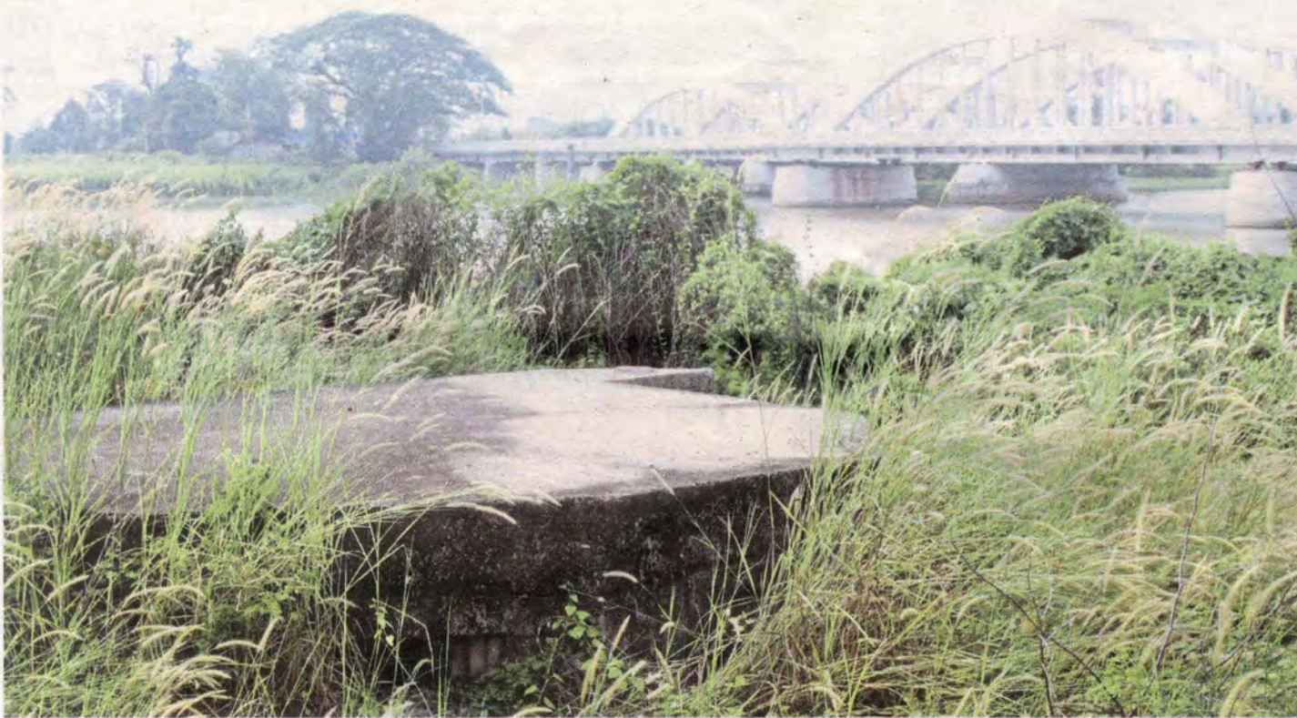
Kubu lama milik British yang terletak 20 meter dari Jambatan Merdeka dipenuhi semak-samun.