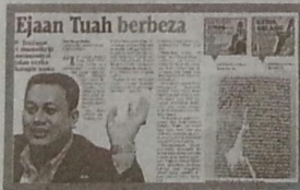
LAPORAN Harian Metro, semalam.

Beliau berkata, kewujudan pahlawan itu juga adalah benar berdasarkan empat ma-