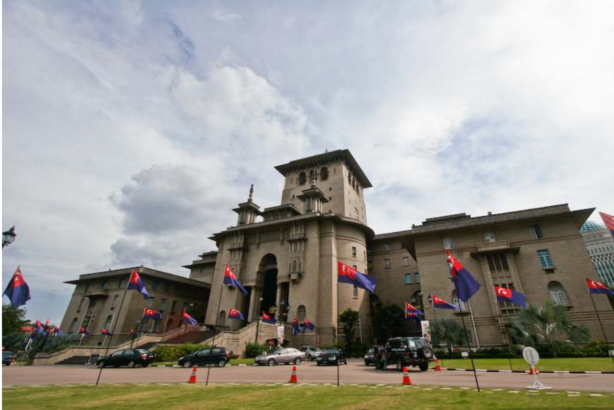
Bangunan Sultan Ibrahim

" Bangunan Sultan Ibrahim, the State Secretariat Building is located on Bukit Timbalan. It houses the state secretariat as well as other offices of the state government."