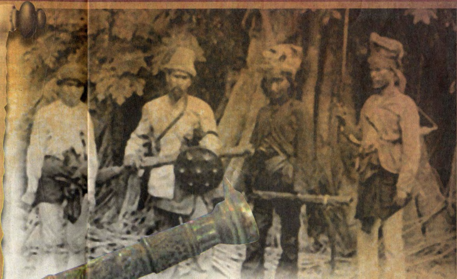
GAMBAR lama menunjukkan orang Melayu sudah menggunakan senjata api. Gambar ini dikatakan diambil pada abad ke-18.

bahawa kilang senapang pernah wujud di Aceh. Antara nama-nama gelaran bagi meriam-meriam Melayu ini adalah Rantaka, Ekor Lotong, Jala Rambang dan Lela.