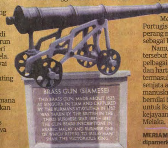
BRASS GUN (SIAMESE)

MERIAM Melayu Singgora yang dipamerkan di London.