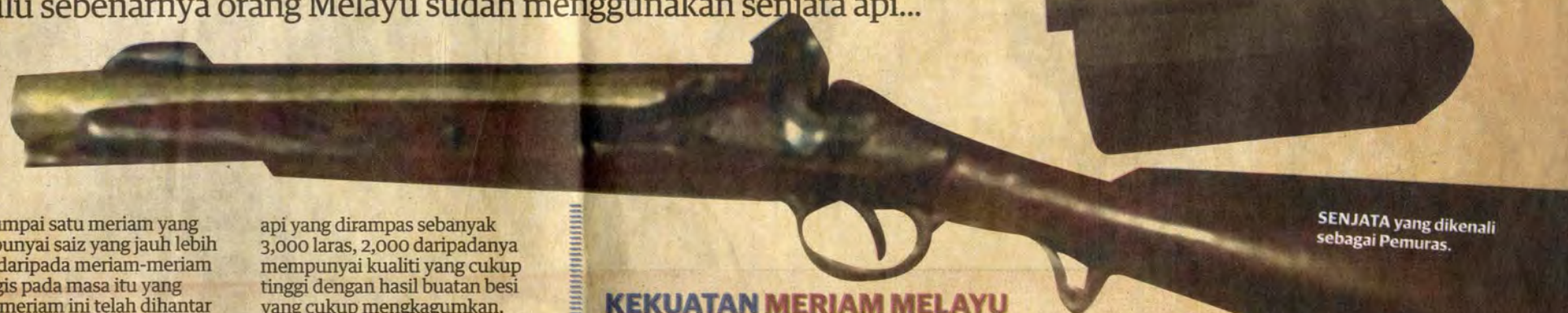
SENJATA yang dikenali sebagai Pemuras.