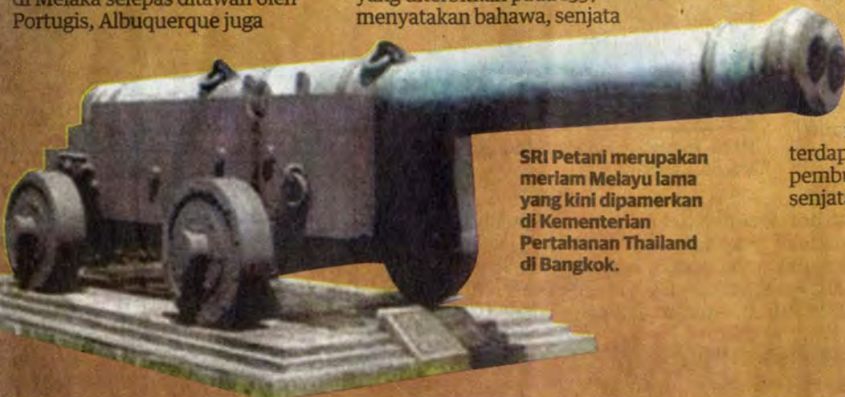
SRI Patani merupakan meriam Melayu lama yang kini dipamerkan di Kementerian Pertahanan Thailand di Bangkok.

terdapat sebuah pusat pembuatan atau kilang senjata Melayu di sana.