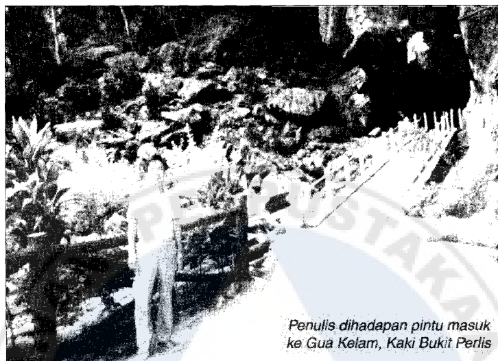
Penulis dihadapan pintu masuk ke Gua Kelam, Kaki Bukit Perlis

unik dan menarik kerana ia merupakan satu dari dua gua seumpama ini yang terdapat di dunia. Justeru itu, tidak hairanlah setiap hari minggu dan hari-hari umum Gua Kelam dibanjiri dengan pelancong dari seluruh negara dan luar negara. Hari ini kerajaan negeri telah menyediakan pelbagai kemudahan seperti kolam mandi, tempat letak kenderaan, gerai-gerai makanan, surau dan lain-lain lagi.